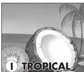
I TROPICAL PK 750 Disegno I PK 750 Design I