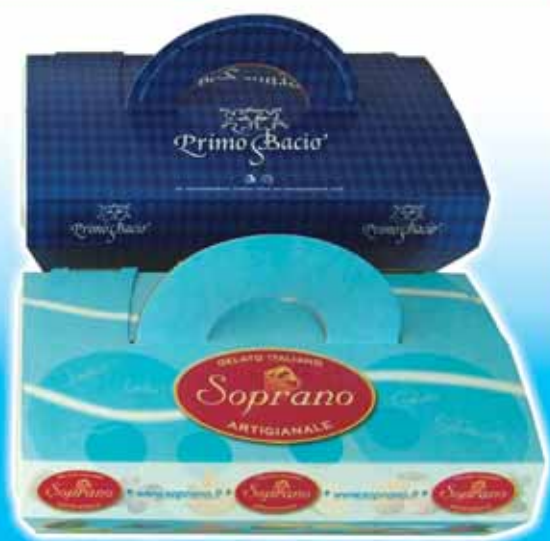
Serie PK Personalizzati PK Special Printed Series