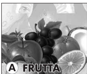
A FRUTTA PK 500 Disegno A PK 500 Design A