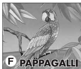
F PAPPAGALLI PK 1500 Disegno F PK 1500 Design F