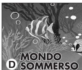
D MONDO SOMMERSO PK 1000 Disegno D PK 1000 Design D