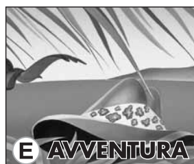
E AVVENTURA PK 450 Disegno E PK 450 Design E